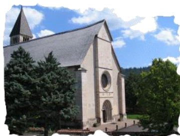
Basilica dei Santi Martiri Sanzeno (TN)