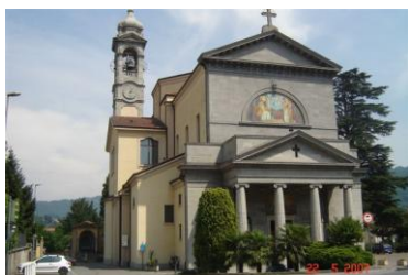
Chiesa Prepositurale di Brivio

Presente in mezzo a noi per sempre è il Figlio e fa da ponte tra il tempo e l'eterno: per lui sia gloria al Padre nei cieli, nel Santo Spirito, fonte di vita.